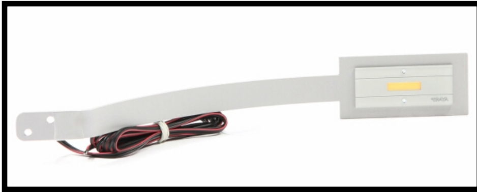
PRZYKŁADOWY KOLOR JASNO SZARY