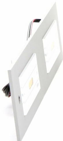
TYŁ LAMPY - montaż za pomocą 2 wkrętów (w zestawie)